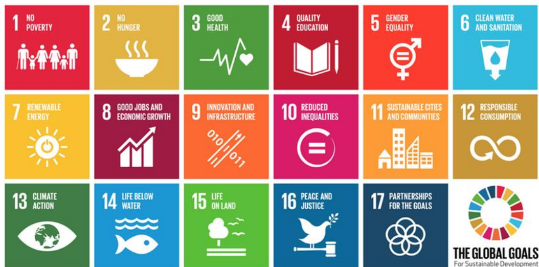
De 17 duurzame ontwikkelingsdoelstellingen voor 2030 van de VN.

Belangrijkste punt van aandacht om dit project te kunnen realiseren was de financiering. De financiële stromen en verantwoordelijkheden voor renovaties van onderwijshuisvesting zijn strak omlijnd. Belangrijk moment voor de gemeente was dat het schoolbestuur ook zelf flink in de buidel tastte. Het vergrootte het gevoel dat 'we er samen uitkomen'. Voor dit project is ook buiten de reguliere financieringsstromen gekeken. Uit de evaluatie bleek dat dit een mooi voorbeeld is, maar dat het meteen vervolgvragen oproept: is dit haalbaar voor de andere scholen die nog gerenoveerd moeten worden? En ook: dit project is mede gerealiseerd door de ervaring en (technische) deskundigheid van de projectleider. Deze kennis en ervaring is met zijn pensionering verdwenen. Hoe kun je dit opvangen, nu voor volgende projecten deze kennis niet meer bij de schoolbesturen aanwezig is? Kortom, hoe houd je voor vervolgttrajecten zowel de expertise als de (intrinsieke) motivatie vast?