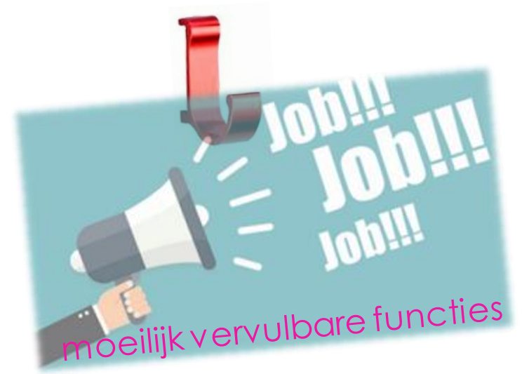
moelijk vervulbare functies